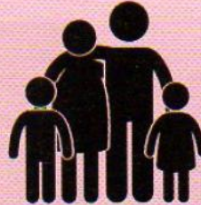
La famille (le père, la mère, le frère, la sœur)