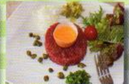
Une tartare de boeuf