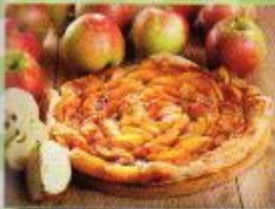
Une tarte aux pommes